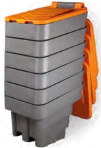
BACS À SEL EMPILÉS