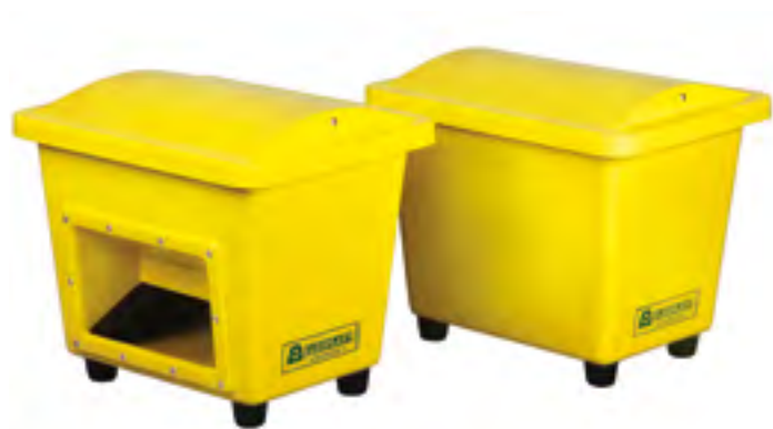
SBA 110 avec/sans ouverture de vidange

Ils sont fabriqués en verre stratifié très durable aux influences mécaniques, météorologiques et chimiques (élimination facile des graffitis). À la demande du client, nous laminons des logos colorés, des inscriptions, des chiffres, etc., dans la surface du bac. Période de garantie de 5 ans.