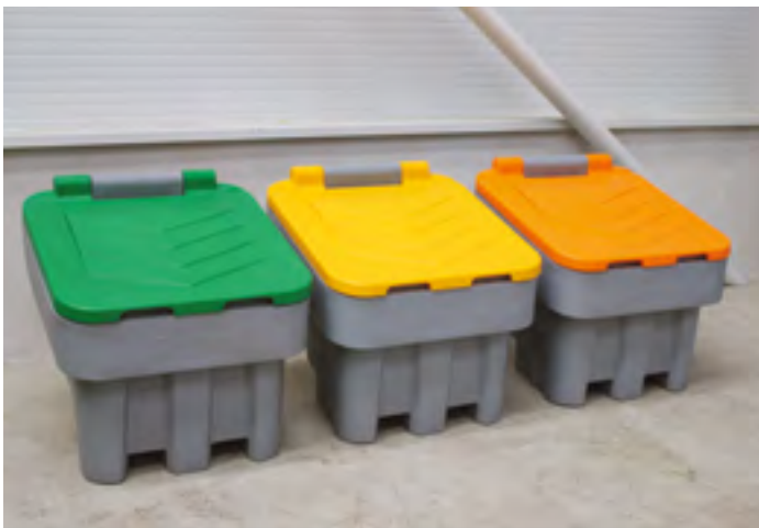
ARROW 400 différentes couleurs de couvercle